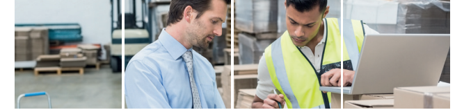
Sachbearbeiter/Sachbearbeiterin in Logistik