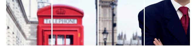
Kaufmännische Weiterbildung – Wirtschaftsenglisch